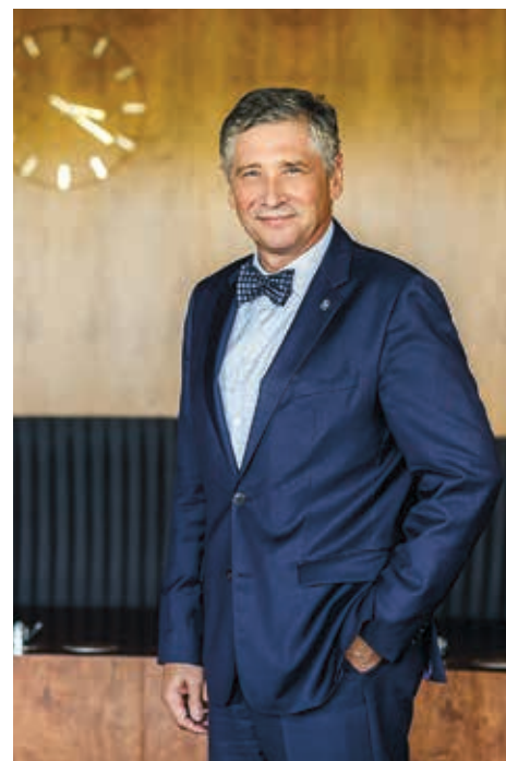
Hejtman kraje Ivo Vondrák

Krajský úřad přijal ve třetím kole kotlíkových dotací 10 tisíc žádostí celkově na 1,3 miliardy korun. „I když od státu dosta-