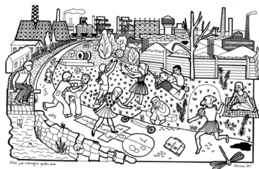
Dětství pod vysokými pecemi