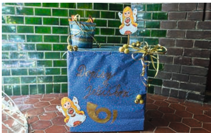
K Vánocům patří i dopisy Ježíškovi.