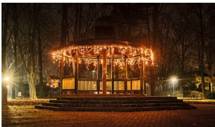
Možná právě někde tady si mohl při své štědrovečerní pouti odpočinout Ježíšek...