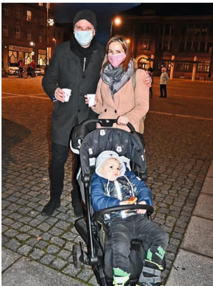
Kdo přišel, musel dodržovat platná bezpečnostní opatření.