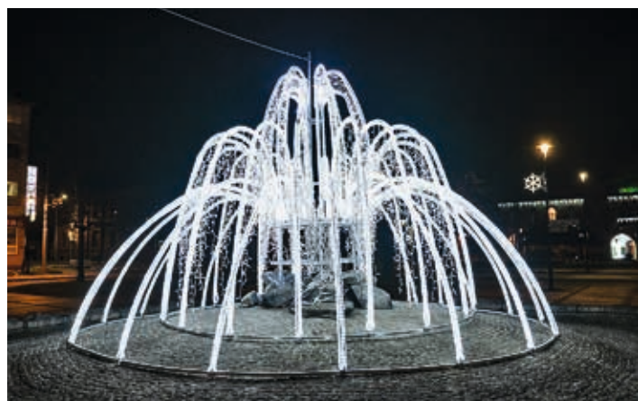
Jako by kašnu na Mírovém náměstí začaroval Mrazík.