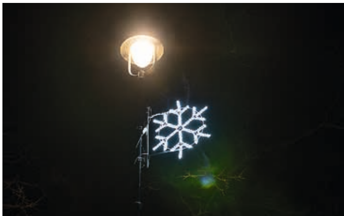
Nad ulicemi se vznášely zářící vločky...