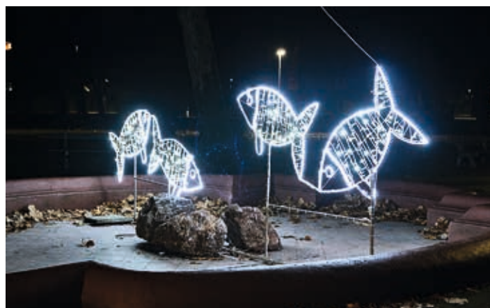
...a pozorovat dovádění stříbrně se mihotajících kapříků.