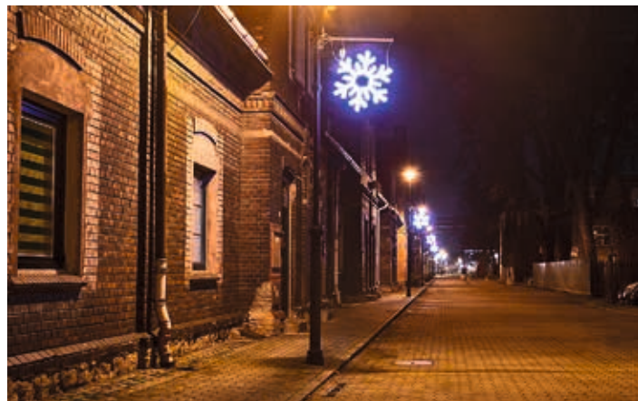
...a dokreslovaly pohádkovou vánoční atmosféru.