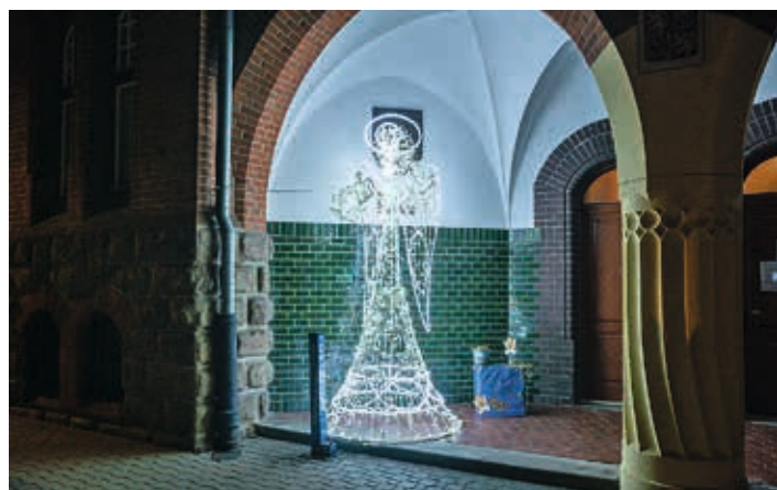
Nad Vítkovicemi bděl o adventu strážný anděl.