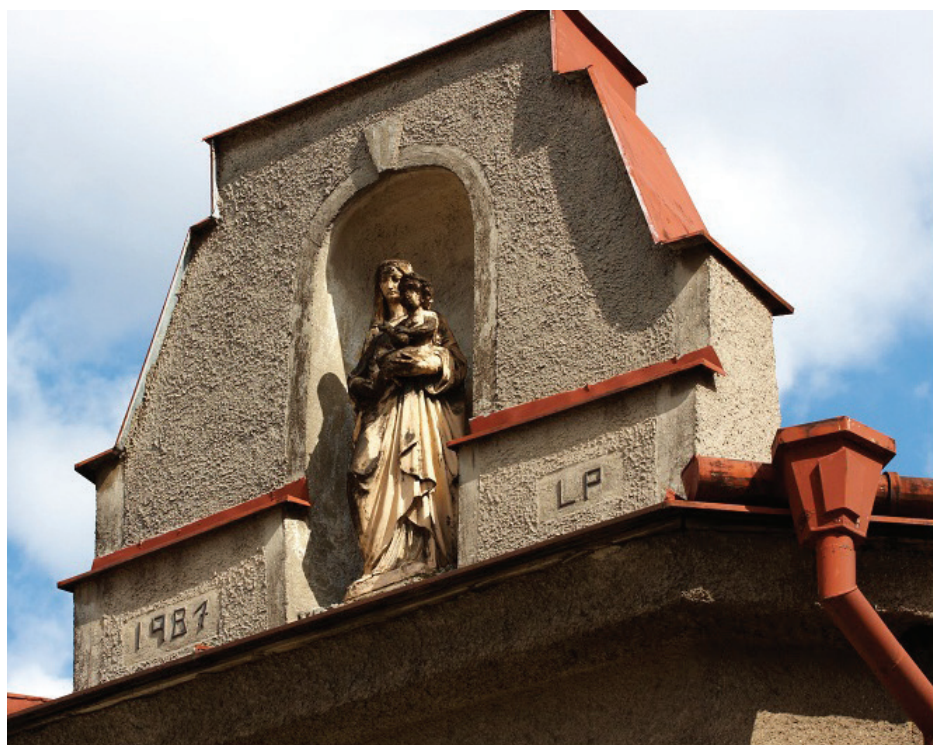
Malá hádanka jen tak...

Víte, na kterém z vítkovických domů se tato ozdoba nachází?