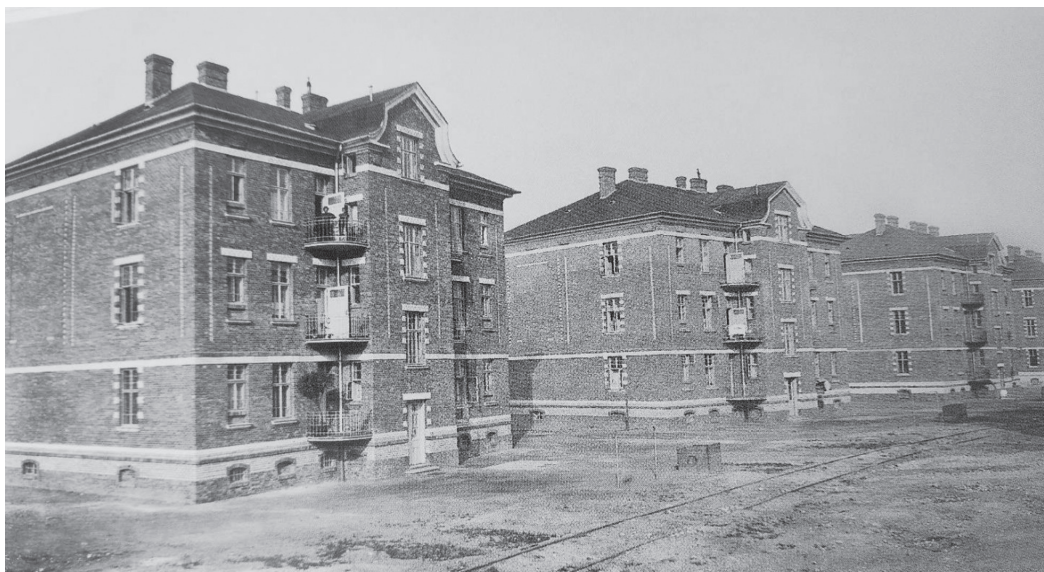
Dobové foto z ul. Štramberské z let 1921–1922 zdroj kniha VÍTKOVICE, str. 34, ISBN 80-238-8498-0

Pokračování v červnovém vydání Vítkovického zpravodaje