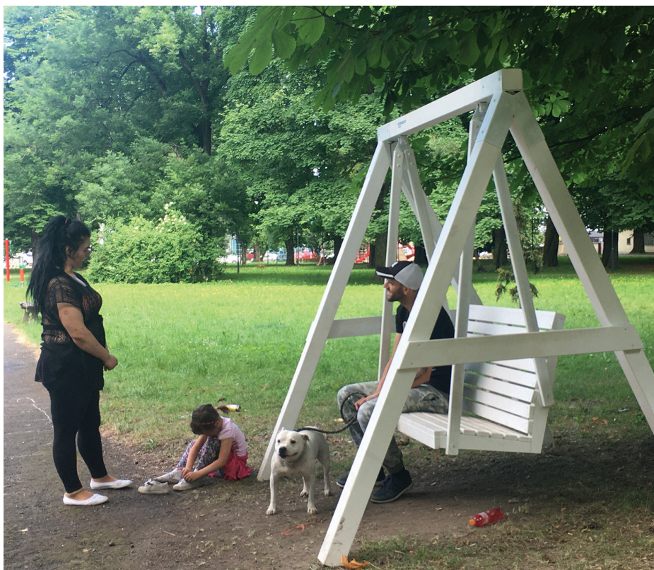
Příjemný odpočinek na houpačce u altánu v sadě Jožky Jabůrkové