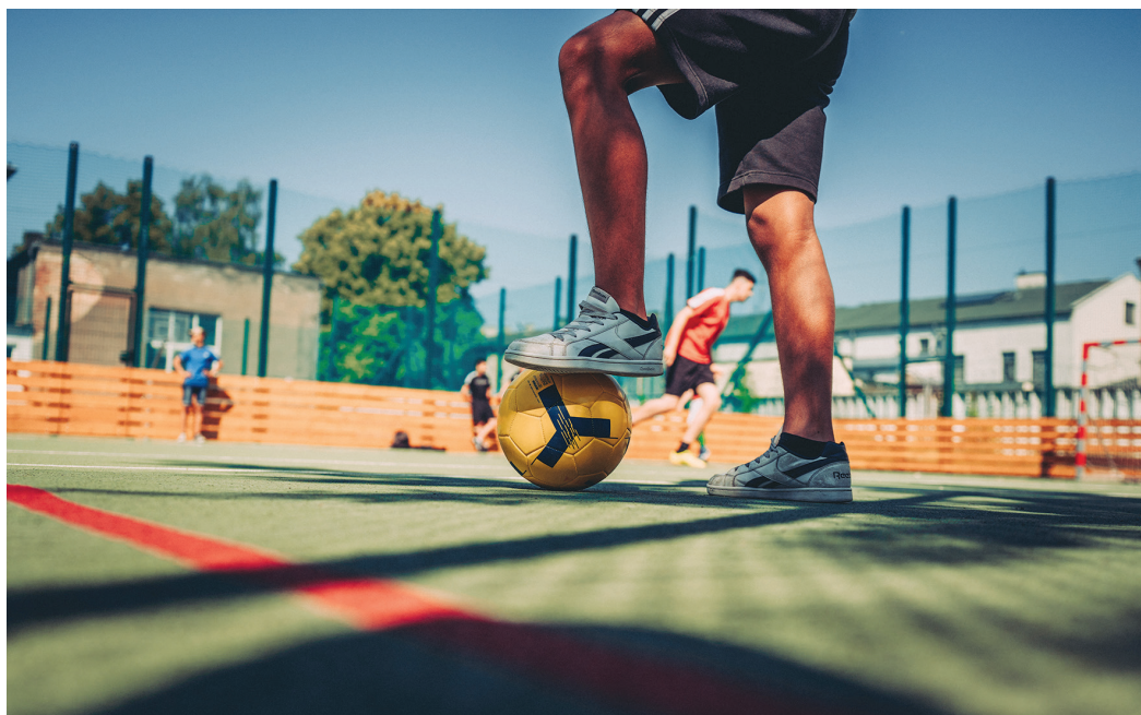
Víceúčelové hřiště v ulici Halasově.

Hřiště jsou otevřena převážně od dubna do října v odpoledních hodinách, o víkendech a o prázdninách. Jejich chod zajišťují správci, sportovní asistenti a další personál tak, aby byla