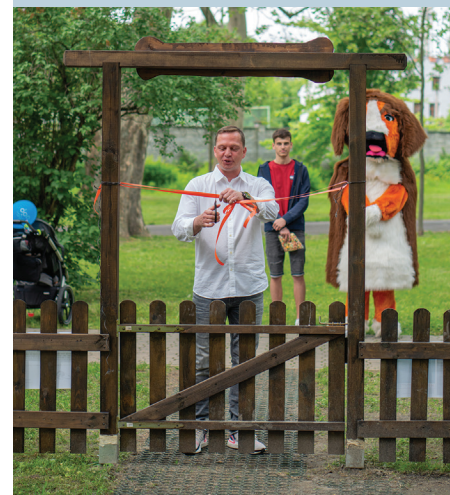
Slavnostní otevření agility parku. Více na straně 11.