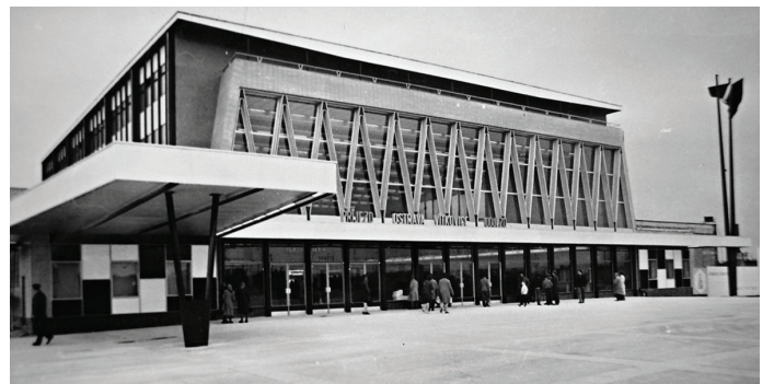
Nádraží na počátku 70. let