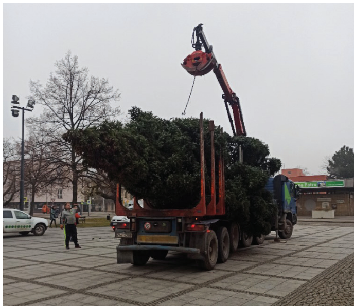
Smrk ze Žermanic dorazil ve středu 23. listopadu

Prožijte příjemný adventní podvečer se sousedy a známými a užijte si rozsvícení vánočního stromu. Kdy? V pondělí 5. prosince v 16.30 hodin na Mírovém náměstí. Možná přijde i Mikuláš... Na setkání srdečně zve vedení městského obvodu Vítkovice. -red-