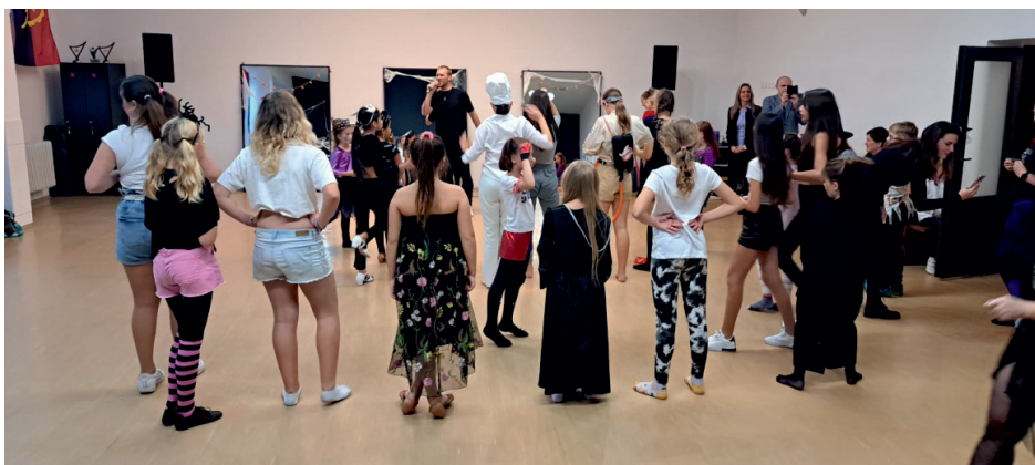
Nový sál bylo třeba hned vyzkoušet...