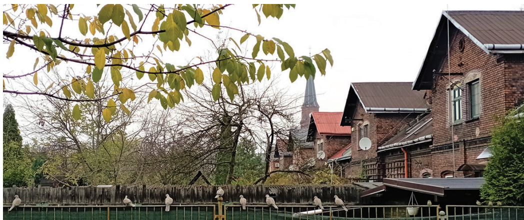
Ve Vítkovicích je stále na co se dívat. Jen je třeba se někdy zastavit a potočit hlavu. Příjemné rozhledy, i když někdy až po rozplynutí ranních mlh, přeje autor snímku Karol Hercík.

Žádosti lze předkládat od 2. ledna do 20. února 2023 (do 12 hodin).