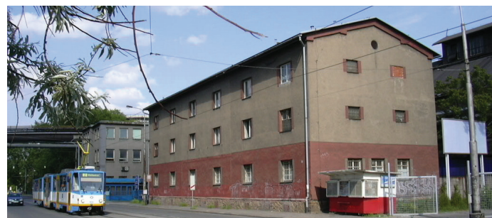
Jediný dům Verdunské kolonie.