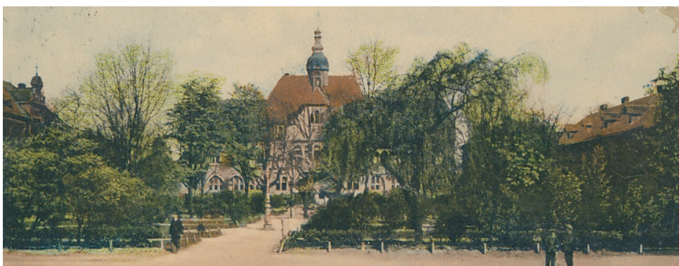
...a přibližně v roce 1910

Vedení obvodu se opravdu pečlivě připravuje na oslavy 120. výročí otevření vítkovické radnice. Působná historická budova při této příležitosti dostane ke svým narozeninám hned dva nádherné dárky. Jaké? Více prozradíme v zářijovém vydání zpravodaje a možná... Možná až po oslavách. Proto prosím bedlivě sledujte jak následující číslo vítkovického měsíčníku, tak sociální síť a webové stránky obvodu a nenechtejte si ujít aktuální informace o chystaném Dni Vítkovic!!!, který se uskuteční 9. září.