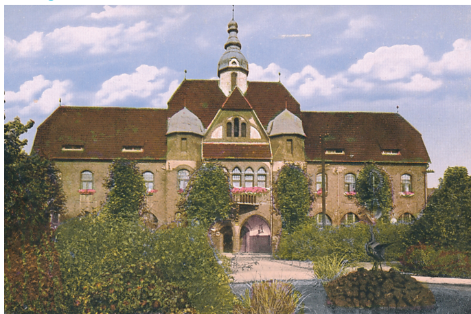
...zhruba v roce 1905...

Vedení obvodu se opravdu pečlivě připravuje na oslavy 120. výročí otevření vítkovické radnice. Působná historická budova při této příležitosti dostane ke svým narozeninám hned dva nádherné dárky. Jaké? Více prozradíme v zářijovém vydání zpravodaje a možná... Možná až po oslavách. Proto prosím bedlivě sledujte jak následující číslo vítkovického měsíčníku, tak sociální síť a webové stránky obvodu a nenechtejte si ujít aktuální informace o chystaném Dni Vítkovic!!!, který se uskuteční 9. září.