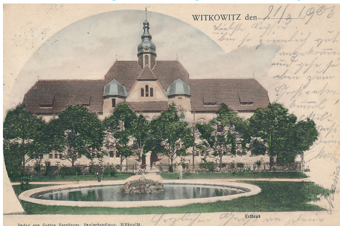
Podívejte se, jak to vítkovické radnici slušelo v roce 1903, ...