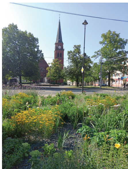
Prostor před radnicí