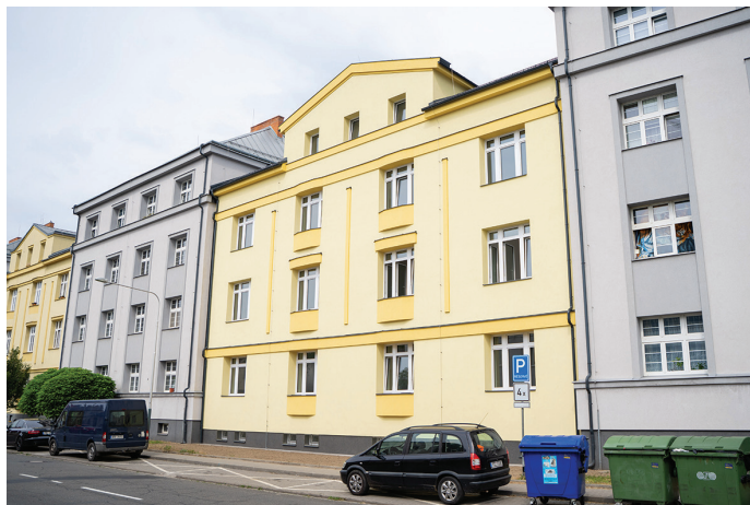
Zachráněný dům dělá radost všem.

Změnou dispozičních řešení a realizací půdních vestavěb bylo portfolio bytů