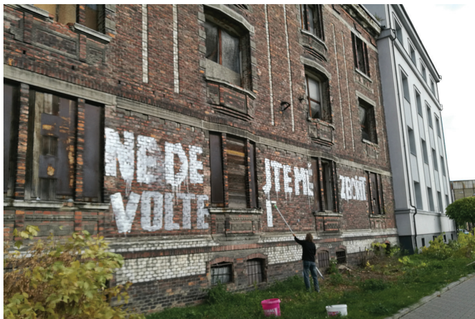
Více o boji o záchranu Štramberské 10 naleznete na straně 6.

Bytový dům s osmi byty byl před 100 lety, v roce 1922, jako volně stojící objekt s číslem popisným 732 v ulici Štramberské 10 ve Vítkovicích předán do užívání zaměstnancům Vítkovického horního a hutního těžířstva.