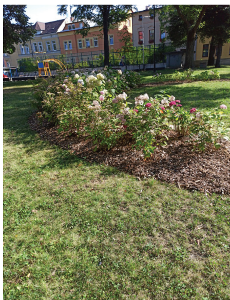
Trvalky v Kutuzovově ulici

Text a foto: Odbor komunálních služeb a hřbitovní správy