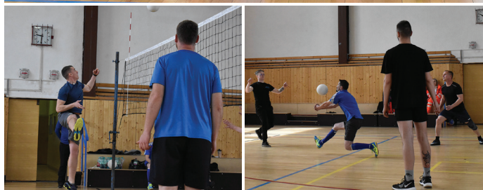
Jak je vidět, vítkovický volejbalový turnaj se opravdu vydařil, ale byl náročný...