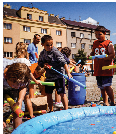
Hrajeme si bez rozdílů, rok 2021