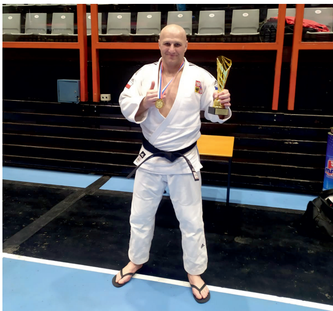
Vítězství na letošním mezinárodním mistrovství Slovenska.