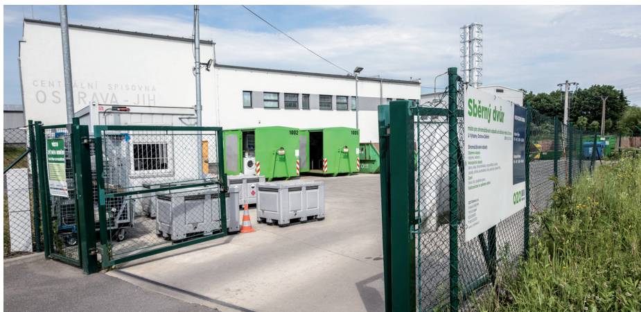
Vítkovickým je nejbliž sběrný dvůr v Zábřehu.