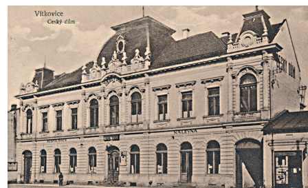
Český dům ve Výstavní ulici na pohlednici z 30. let 20. století.

Sobota 3. června v 10.00 hodin sraz u kostela na Mírovém náměstí. V pořadí třetí část seriálu zaměřeného na vítkovickou architekturu mapuje stavby, jež nebyly budovány jako součást projektu cihlového města, ale byly stavěny jako soukromá výstavba. Během vycházky hrazené z prostředků