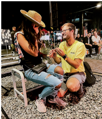
Žádost o ruku.

Hlavním programem ale byly skutečné svatby. Firma Kofola zorganizovala pro šest zamilovaných párů nezapomenutelný zážitek, jímž bylo uzavření manželství přímo na festivalu Colours of Ostrava. Povinností snoubenců před uzavřením samotného sňatku byla návštěva na matrice ÚMOB Vítkovice, kde předložili veškeré své doklady potřebné k uzavření manželství.