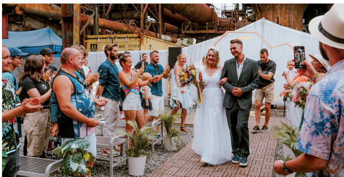
Výjimečný okamžik ve výjimečném prostředí.

Hlavním programem ale byly skutečné svatby. Firma Kofola zorganizovala pro šest zamilovaných párů nezapomenutelný zážitek, jímž bylo uzavření manželství přímo na festivalu Colours of Ostrava. Povinností snoubenců před uzavřením samotného sňatku byla návštěva na matrice ÚMOB Vítkovice, kde předložili veškeré své doklady potřebné k uzavření manželství.