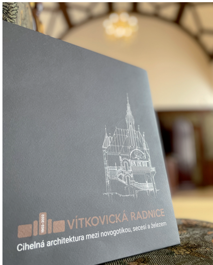
Den Vítkovic, který se uskutečnil v pátek 9. září, bude navždy spojen se křtem unikátní publikace o historii radnice.