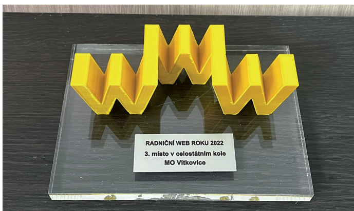
A opět úspěch! Zlatý lajk roku 2022, Radniční web roku 2022, Radniční listy roku 2022.