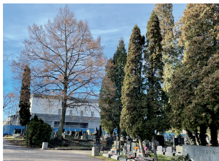
15. ledna 2023