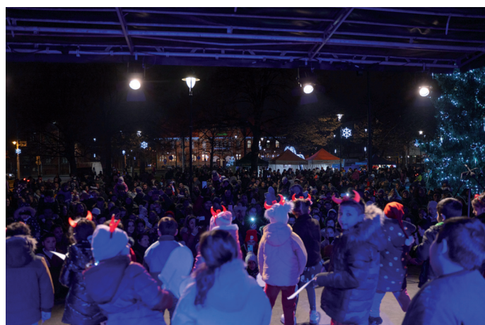
V pondělí 5. prosince jsme se sešli při rozsvícení vánočního stromu.

Text: Lenka Gulašiová