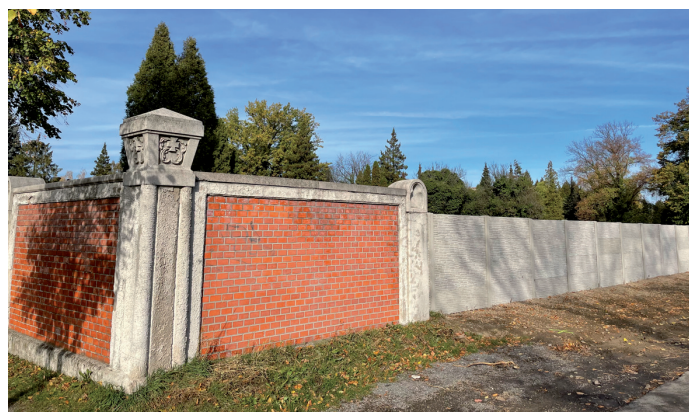
Nový plot hřbitova byl dalším krokem k zvelebení tohoto důstojného místa.