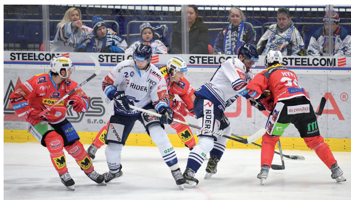
3. Jedna v Ostravě 34. kolo Tipsport Extraligy, HC VÍTKOVICE RIDERA - HC Dynamo Pardubice.

ZPRAVODAJ MĚSTSKÉHO OBVODU VÍTKOVICE , povolil odbor kultury MMO pod č. r. MMO 95/96-PP ze dne 7.2.1996. ZDARMA. Uzávěrka příštího čísla bude 13. 2. 2023. Vítkovický zpravodaj vydává jako měsíčník MOb Vítkovice, Mírové náměstí 1, 703 79 Ostrava-Vítkovice, IČO 00845451, www.vitkovice.ostrava.cz. Zodpovědná redaktorka: Lenka Gulašiová, GSM: +420 605 218 758, gulasiova.lenka@gmail.com. Foto: Lenka Gulašiová, archiv. Grafická úprava: Kateřina Hoferková, tisk: CZECH NEWS CENTER, a. s. Obsah příspěvků nemusí odpovídat názoru redakce. Redakce si vyhrazuje právo na krácení textů.