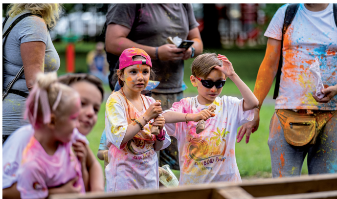
Červenec přinesl už třetí ročník úspěšného projektu Hrajeme si bez rozdíků.