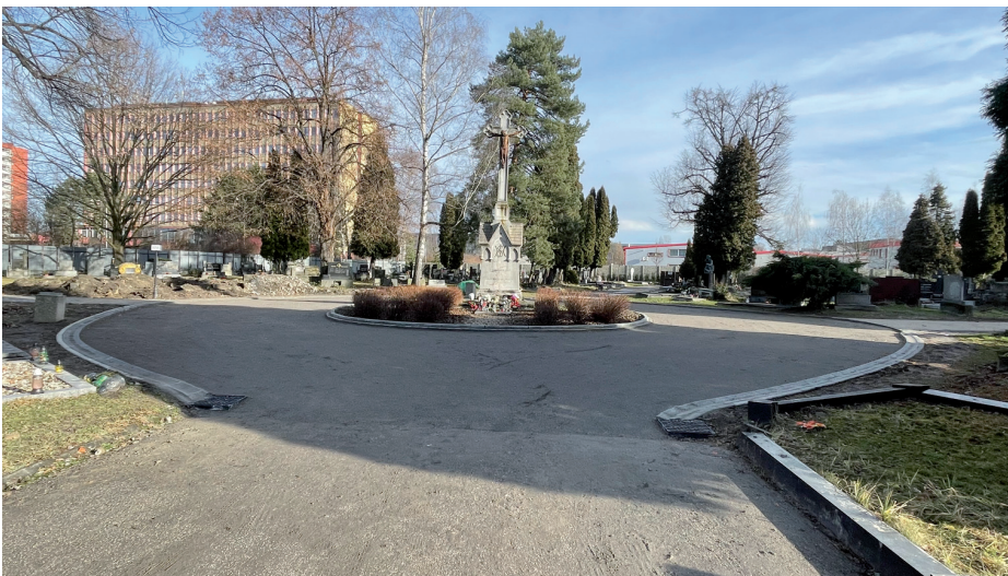
Zde je připraven podklad pro asfaltový povrch.