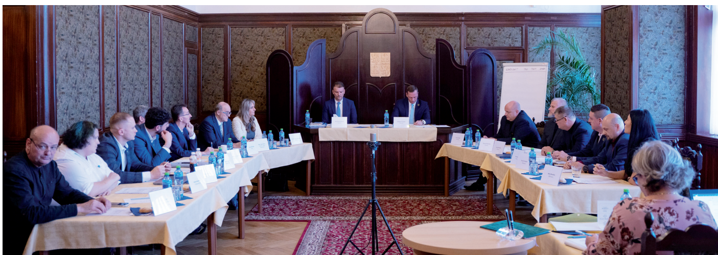
V říjnu složili na ustavujícím zastupitelstvu slib noví zastupitelé a bylo zvoleno vedení Vítkovic.