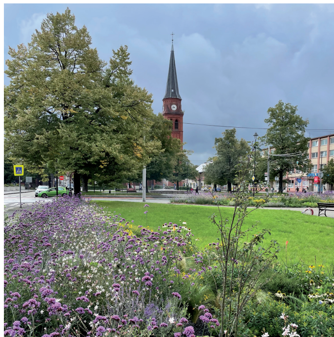
A takhle krásně kvetl nově upravený prostor před vítkovickou radnicí.