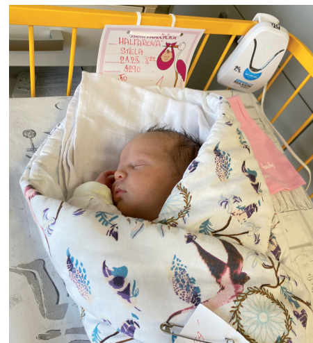
Stela, 1. miminko roku 2023