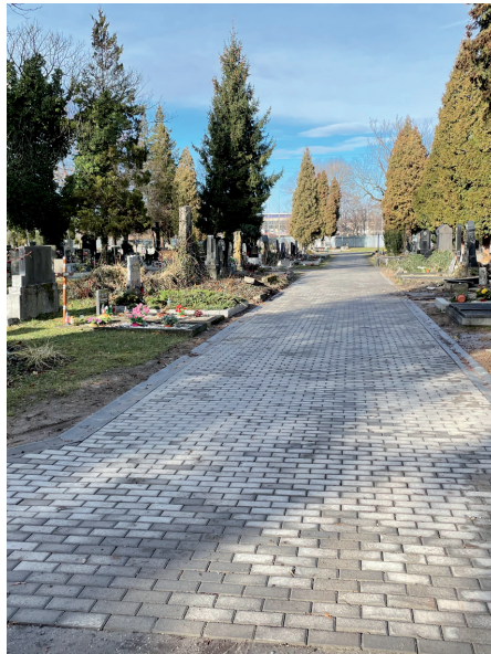
V této části už se po blátě nějaký ten pátek nechodí...