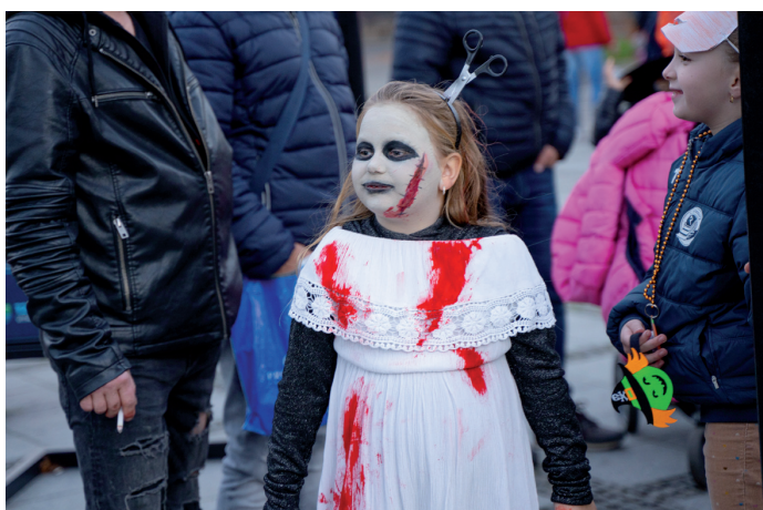
Děsuplný Halloween. Z Mírového náměstí se k Dolním Vítkovickým vydal průvod duchů.