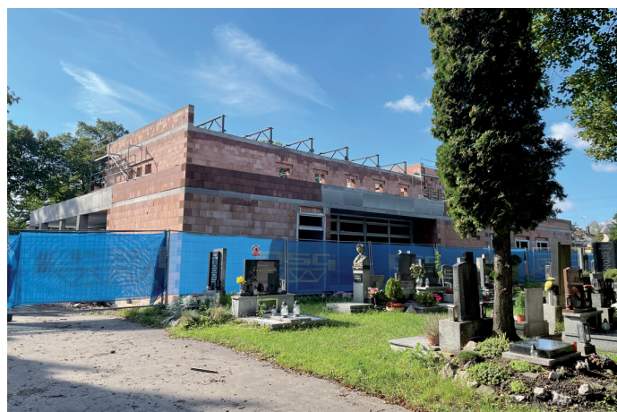
A takhle už v září vypadala stavba nové smuteční síně...