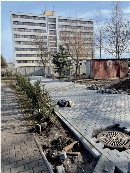
Vlídne lednové počasí umožnilo pokračovat dál.

V lednu v zadním prostoru vítkovického pohřebiště, nedaleko vsypových louček, pokračovaly opravy chodníků.