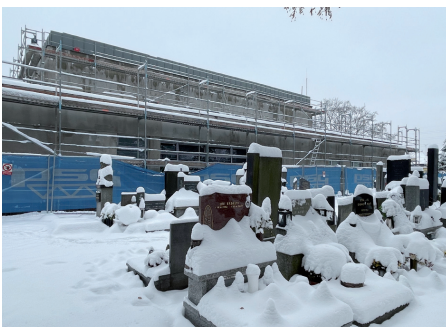
15. prosince 2022