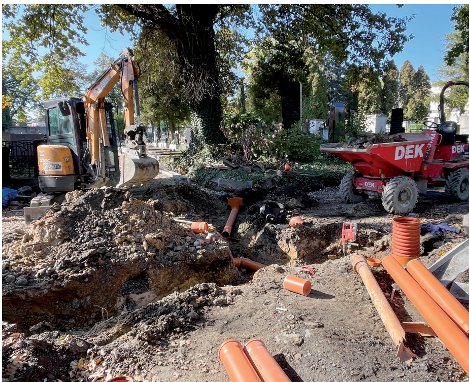
Ve středu 16. října byly práce na chodnících na hřbitově v plném proudu.