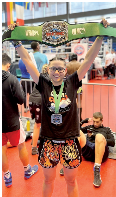
Mistryně světa v kickboxu Olga Kvaiserová.