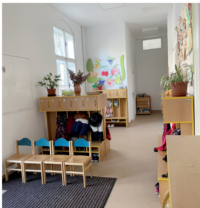
Prostornou šatnu kladně hodnotí zejména rodiče dětí.