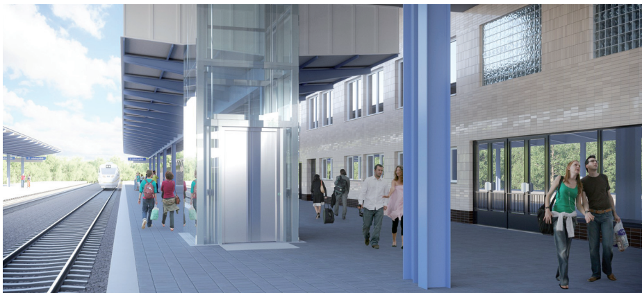
Vizualizace: Správa železnic