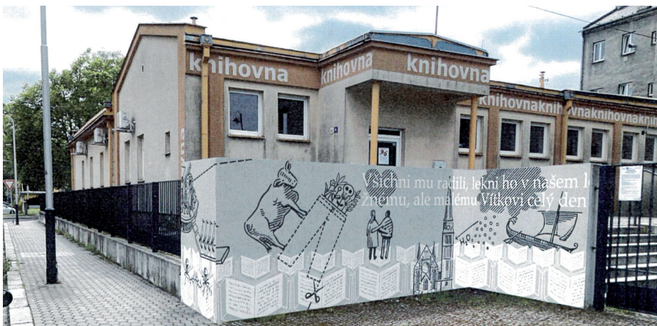
Ilustrační snímek: autoři grafického námětu